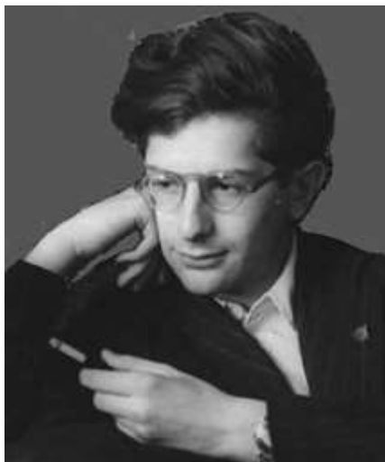
Студент химического факультета Ташкентского университета